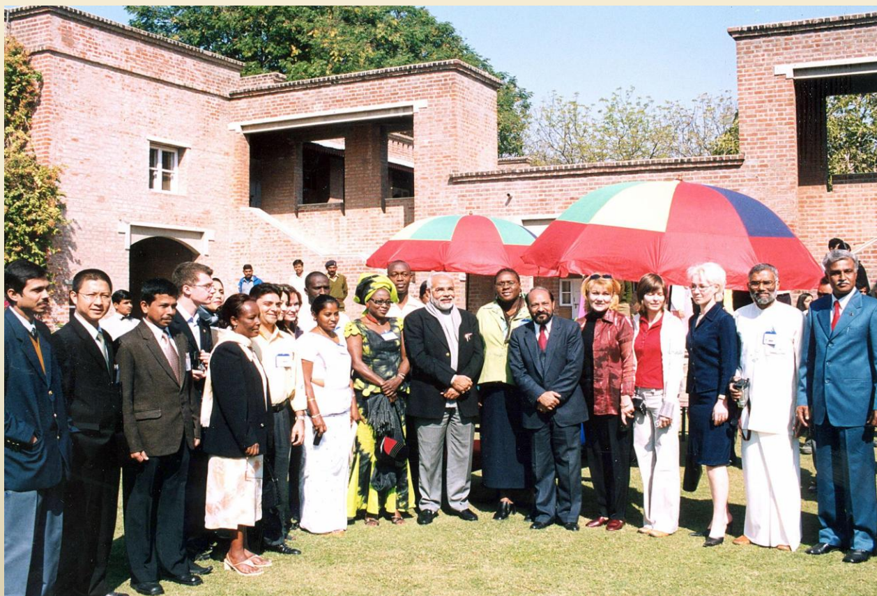
Participants du Programme ITEC 2005-06 avec Shri Narendra Modi, le ministre en Chef du Gujarat de l'époque et actuel Premier ministre de l'Inde

Au départ, le programme ITEC était envisagé comme un programme bilatéral. Cependant, ces dernières années, les ressources de l'ITEC ont également servi aux programmes de coopération conçus dans un contexte régional et interrégional, comme la Commission économique pour l'Afrique, le Département du Développement industriel du Secrétariat du Commonwealth, l'ONUDI, le Groupe des 77 et le G-15. Récemment, ses activités ont aussi été associées à des organisations régionales et multilatérales ainsi qu'à des groupements de coopération, tels que l'Association des Nations de l'Asie du Sud-Est (ANASE), l'Initiative du Golfe du Bengale pour la Coopération technique et économique multisectorielle (BIMST EC), la Coopération Mékong — Gange (MGC), l'Union africaine (UA), l'Organisation afro-asiatique pour le Développement rural (AARDO), le Parlement panafricain, la Communauté caribéenne (CARICOM), l'Organisation mondiale du Commerce (OMC), l'Association des Pays riverains de l'océan Indien pour une Coopération régionale (IOR-ARC) et le Sommet du Forum Inde-Afrique.